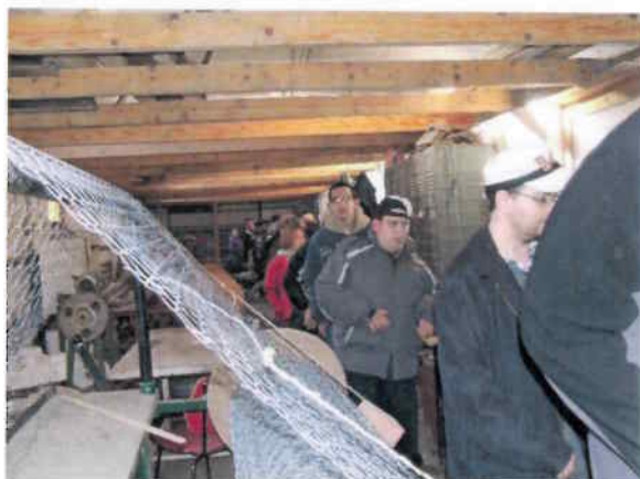
Drótháló szövő műhely a Szimbiózis Alapítványnál