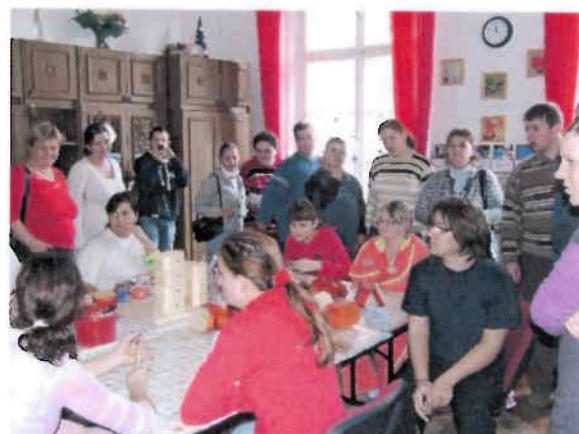
Kreatív kézműves foglalkozás sérült emberek számára