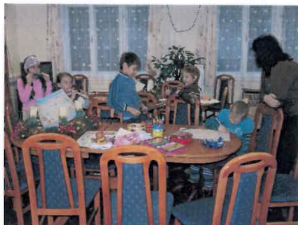
Ismerkedés a hangszerekkel a Zene ABC szakkörön