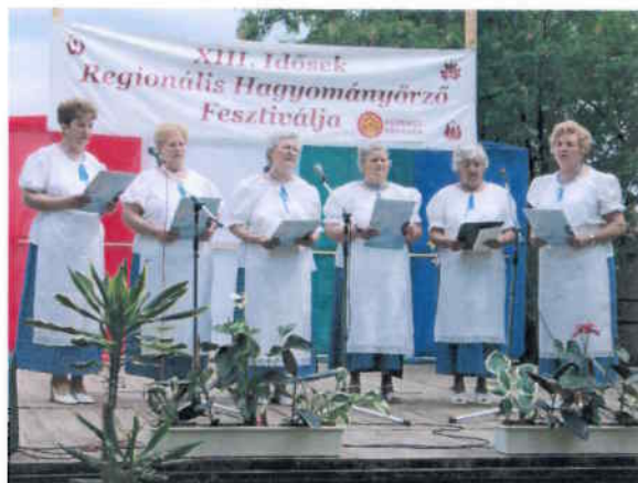
XIII. Idősek Regionális Fesztiválján a Naplemente Nyugdíjasklub