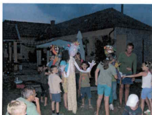
A Mese-Kéz táborban életre kelnek a bábok