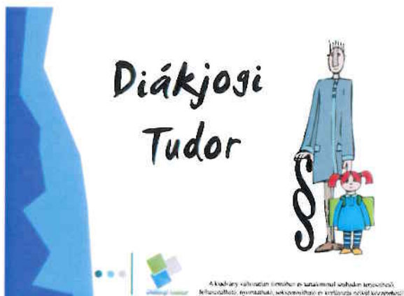
Diákjogi tudor tananyaggal ismerkedtek meg az iskolák diákönkormányzatának tagjai