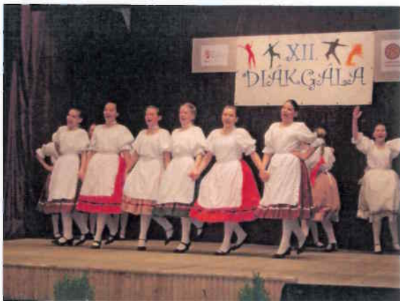
Az Ecsédi Táncegyüttes a XII. Diákgalán