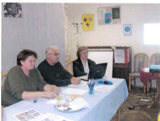
A Felnőttképzési Civil Hálózat szakmai műhelybeszélgetése