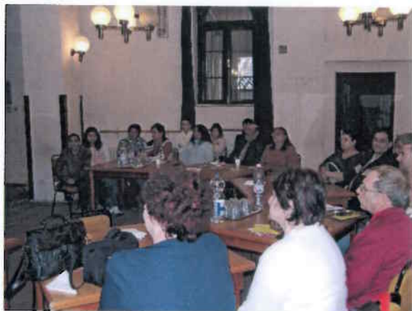
Mozgáskorlátozottak, nagycsaládosok és romák az Esélyek Házában

Demokratikus jogok gyakorlását segítő kompetenciák fejlesztése (kizárólag hátrányos helyzetű célcsoportra irányulhat)