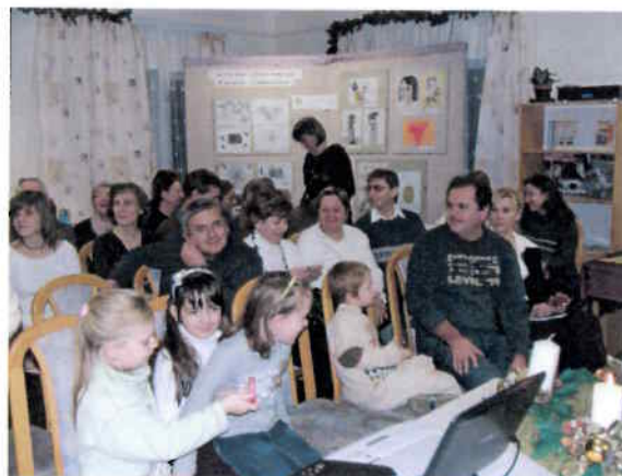
Szakmai konferencia az alapítvány működési helyén