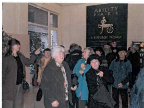
Látogatás az Ability Parkban – A Képességek Próbája