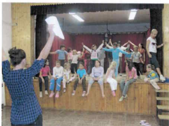
Musical Színpad főpróbája a rózsaszentmártoni táborban