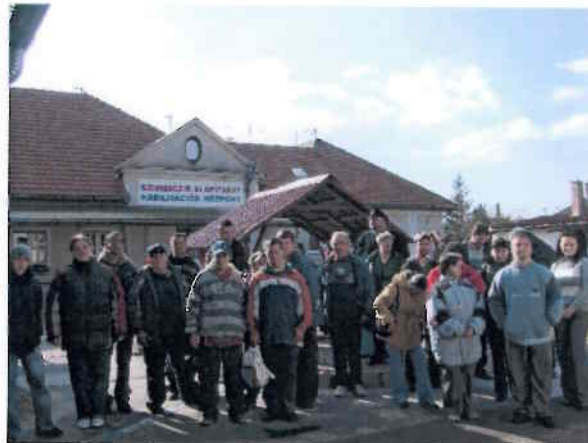
Látogatás a Szimbiózis Alapítvány foglalkoztató központjában