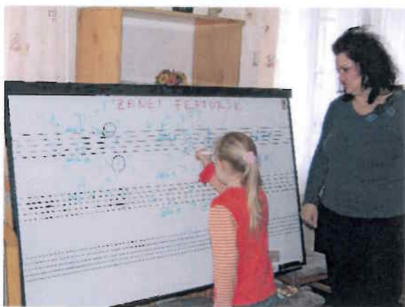
Zenei fejtörők megoldása a zenei tehetségfejlesztő foglalkozáson

Kompetencia alapú, készség és képességfejlesztő szakkörök, táborok, tehetségfejlesztő programok