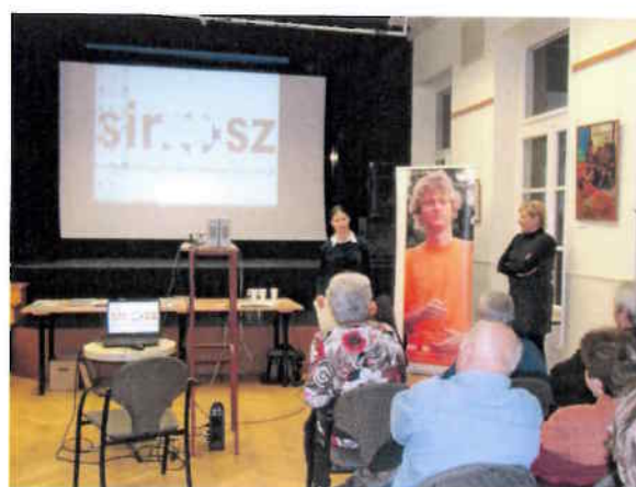
Érdekvédelmi előadás a SINOSZ Székházban