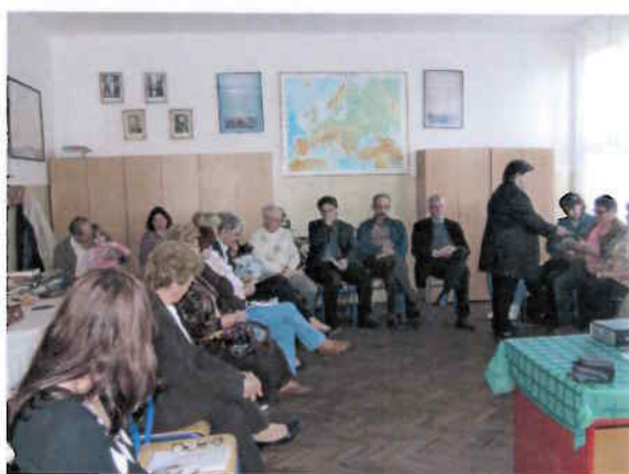
Heves megyei és Lévai civilszervezetek találkozója Léván