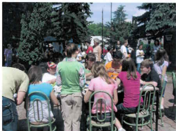
Bőrműves foglalkozás a gyermeknapon